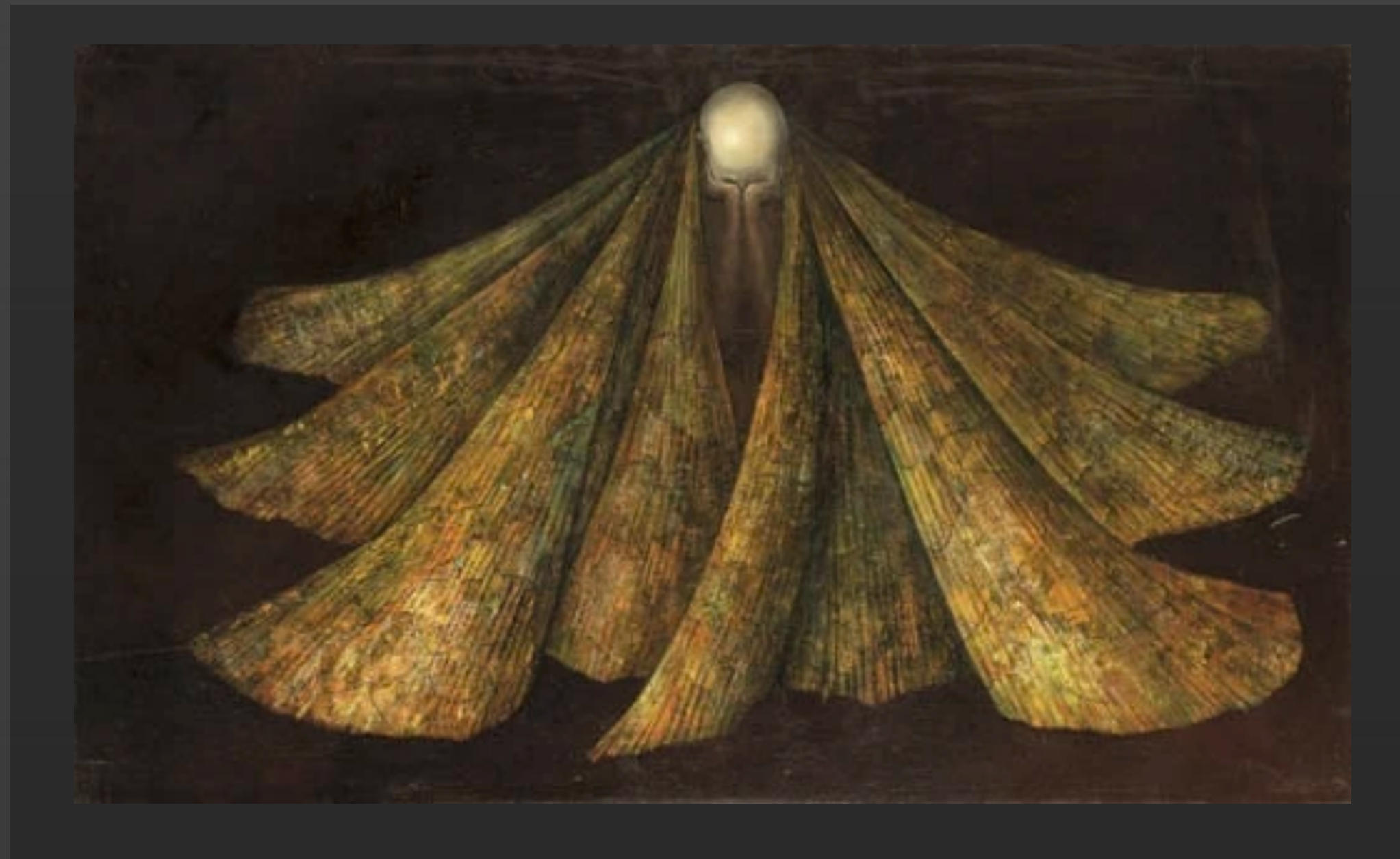
El enrollamiento del silencio , de Leonor Fini (1955)